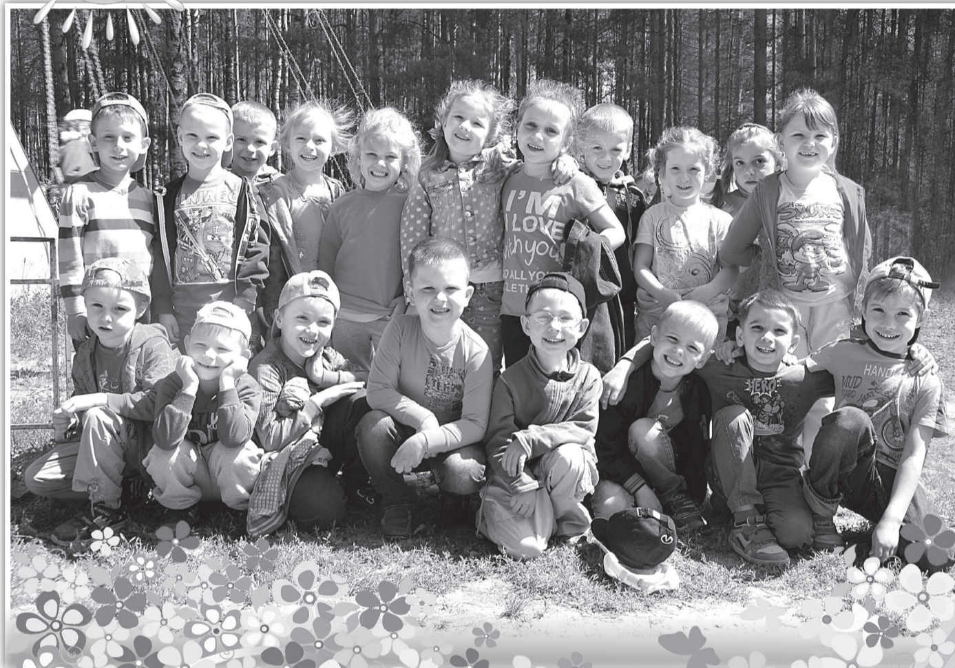
Дети из группы «Земляничка» детского сада №3 в городском парке.

В среду, 1 июня в нашем городе прошли праздничные мероприятия, посвящённые Международному дню защиты детей. Сказочный спектакль, звонкие песни, катание на аттракционах, рисунки на асфальте, в общем, развлечения на любой вкус для детворы подготовили работники культурных учреждений города.